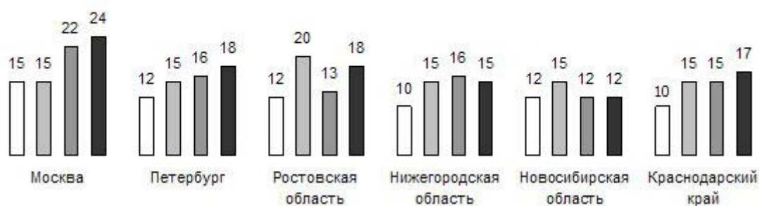
Динамика зарплаты торгового представителя в 2004—2007, тыс. руб. (без учета бонусов, и дополнительных компенсаций) □ 2004 ■ 2005 ■ 2006 ■ 2007

от них в значительной степени зависит доход фирмы. В этом году средний оклад торгового представителя в Москве составил 24 000 рублей, плюс к этому обязательно процент с продаж. Таким образом, средний совокупный уровень дохода — около 40 000 рублей.